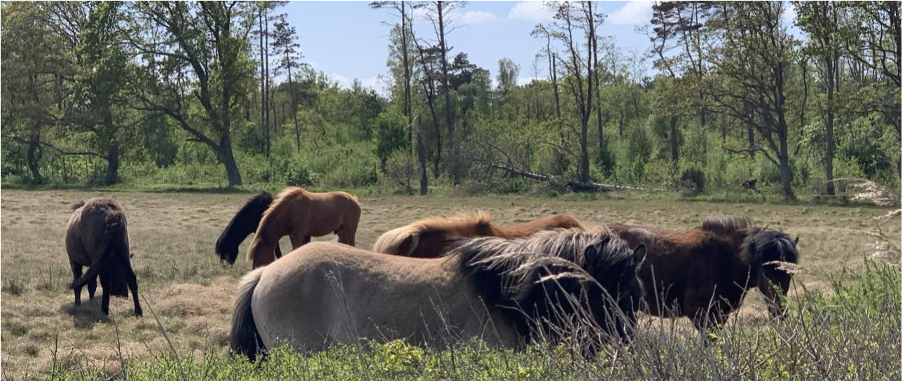
Foto: Engen ved Sonnerup Skov