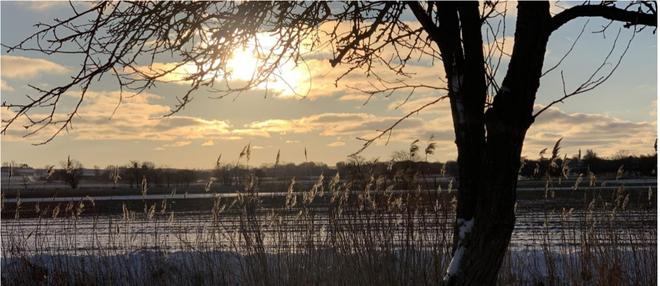
Foto: Vinterudsigt over marken